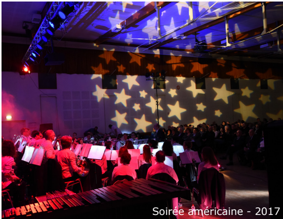
Soirée américaine - 2017